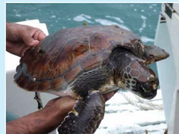
Tartaruga verde é devolvida ao mar pelas equipes dos projetos Gremar e Petrechos de Pesca Perdidos no Mar. Pág. 3