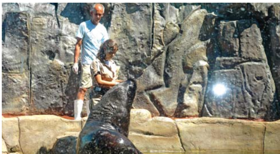
Leão-marinho traz alegria ao Aquário de Santos. Pág. 3